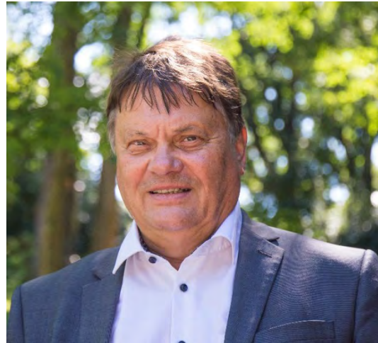
Dietmar Strehl; Senator für Finanzen

Das Haushaltsjahr 2021 war, wie bereits im Vorjahr, neben dem Kernhaushalt stark von zusätzlichen Ausgaben auf Grund der Corona-Pandemie geprägt. Gleichzeitig deutete sich im laufenden Jahr bereits eine Entspannung der Einnahmen an.