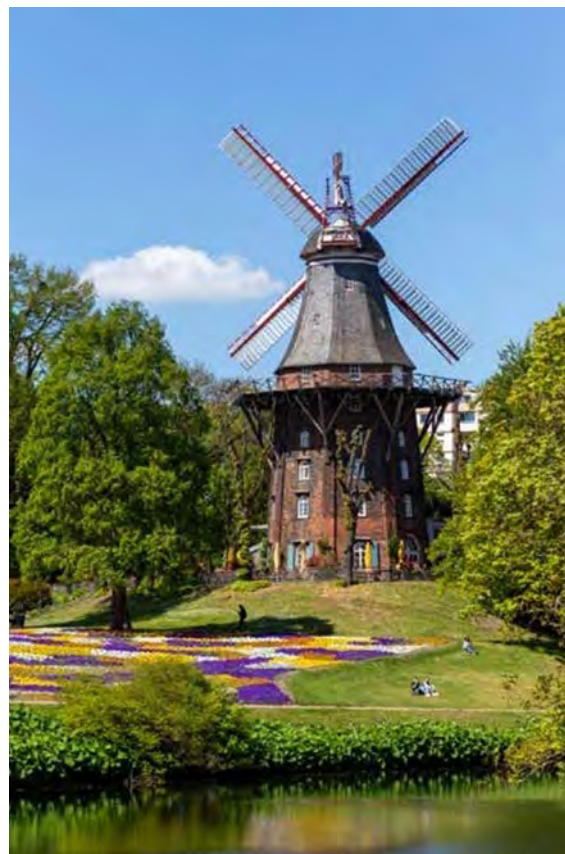
Mühle am Wall

Der Jahresfehlbetrag errechnet sich aus dem Verwaltungs- und dem Finanzergebnis (zzgl. Steuern, -94,00 Euro) und wird 2021 in der Stadtgemeinde Bremen mit -953,27 Mio. Euro ausgewiesen.