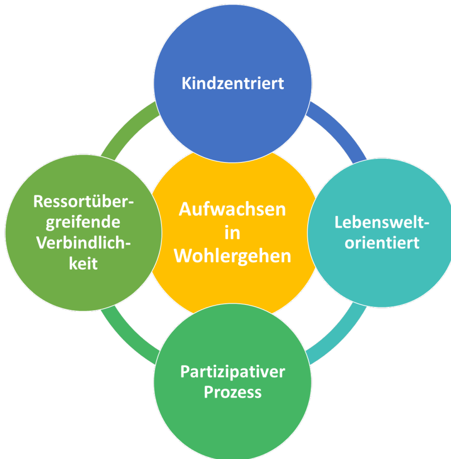
Abbildung 1 Inhaltliche Orientierungspunkte der Gesamtstrategie "Frühe Kindheit"

Erste inhaltliche Orientierungspunkte der Gesamtstrategie „Frühe Kindheit“ wurden im Eckpunktepapier am 10.10.2022 gemeinsam verabschiedet: